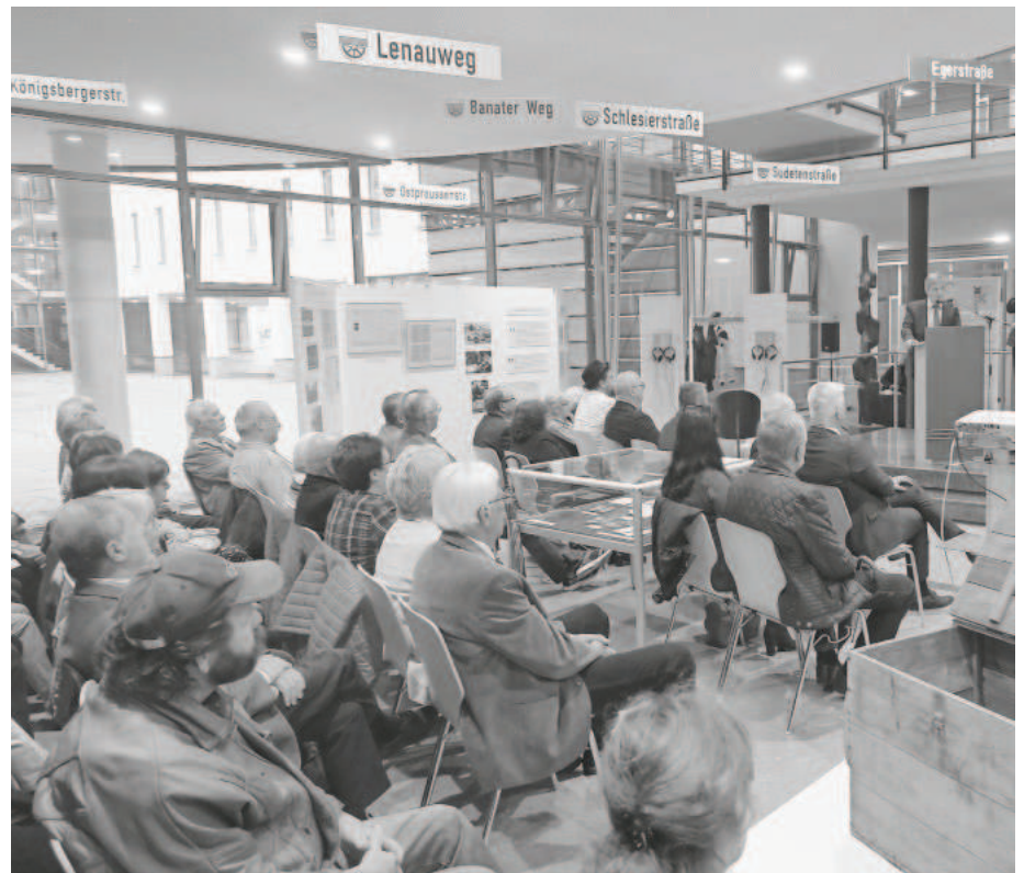
Foto: Besucher Ausstellung Zuwanderung.jpg