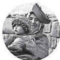
La Balanza e.V.